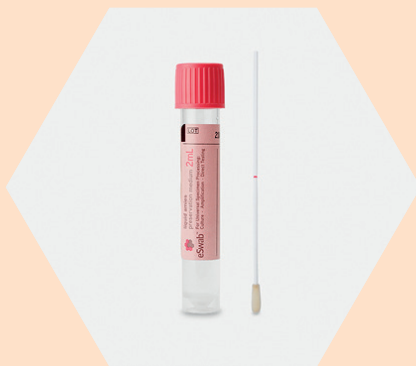
1 eSwab roze dop

NB: De eSwab met blauwe dop (nummer 2) alleen nog gebruiken voor afnames bij kleine kinderen.